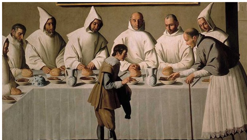
San Hugo en el refectorio (Zurbarán)

Alonso Cano (1601-1667), con temática religiosa, cuenta con una de sus obras emblemáticas, Cristo muerto sostenido por un ángel.